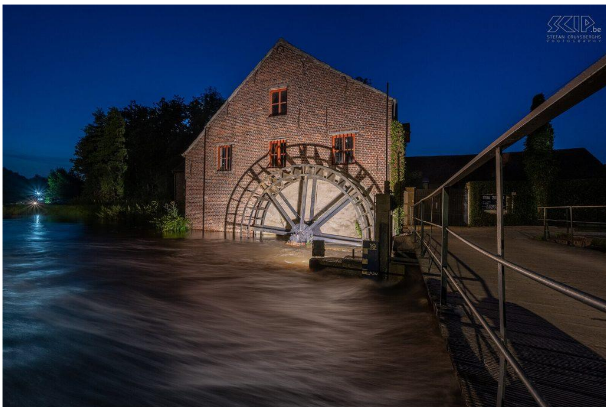
Watermolen In Zichem